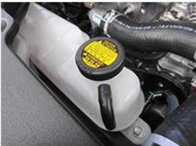
ラジエーターリザーバータンク