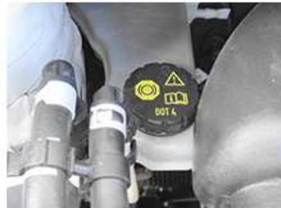
ブレーキ液リザーバータンク