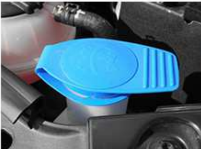
ウォッシャータンク